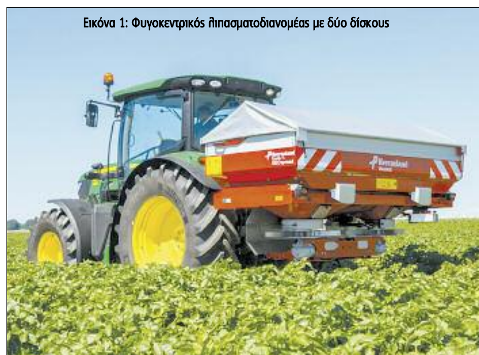
Εικόνα 1: Φυγοκεντρικός λιπασματοδιανομείς με δύο δίσκους

Για την εφαρμογή χρησιμοποιούνται κατά κανόνα οι φυγοκεντρικοί λιπασματοδιανομείς τα λεγόμενα «χωνία» από τους αγρότες (Εικόνα 1). Είναι μηχανήματα που εκτοξεύουν το λιπάσμα από ένα κεντρικό σημείο σε όλη την επιφάνεια του αγρού. Έχουν ένα σημαντικό πλεονέκτημα. Ότι η αποθήκη (το χωνί) μπορεί να πληθύνει στην πλατφόρμα με τα λιπάσματα (με όποια κίνηση του τρακτέρ) και η τροφοδοσία να γίνει με ελάχιστο κόπο. Το μεγάλο