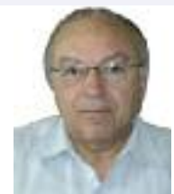
Γράφει ο Φάνης Γέμος*

Τα λιπάσματα είναι σήμερα πολύ ακριβά και φτάνουν να είναι το 30% του κόστους παραγωγής στις μη αρδευόμενες καλλιέργειες. Τα λιπάσματα (κυρίως φωσφόρος και κάλιο και λιγότερο το άζωτο) δεν μετακινούνται οριζόντια αλλά μένουν όπου πέφτουν. Επομένως αν δεν διανεμηθούν σωστά αλλιώς θα περισσέψουν και αλλού θα είναι λιγότερα από όσα χρειάζονται.