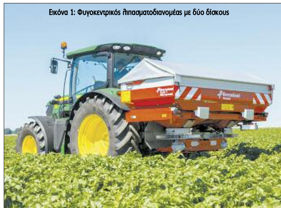
Εικόνα 1: Φυγοκεντρικός λιπασματοδιανομείς με δύο δίσκους

Για την εφαρμογή χρησιμοποιούνται κατά κανόνα οι φυγοκεντρικοί λιπασματοδιανομείς τα λεγόμενα «χωνία» από τους αγρότες (Εικόνα 1). Είναι μηχανήματα που εκτοξεύουν το λίπασμα από ένα κεντρικό σημείο σε όλη την επιφάνεια του αγρού. Έχουν ένα σημαντικό πλεονέκτημα. Ότι η αποθήκη (το χωνί) μπορεί να πληθύνει στην πλατφόρμα με τα λιπάσματα (με όποια κίνηση του τρακτέρ) και η τροφοδοσία να γίνει με ελάχιστο κόπο. Το μεγάλο