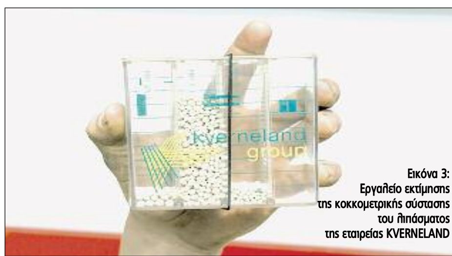
Εικόνα 3: Εργαλείο εκτίμησης της κοκκομετρικής σύστασης του λιπασματος της εταιρείας KVERNELAND

Για διάφορους λόγους οι αγρότες μας δεν έδωσαν ιδιαίτερη σημασία στην ποιότητα των λιπασματοδιανομμένων τους. Ίσως γιατί τα λιπάσματα επιδοτούνταν παλαιότερα και ήταν φθηνά, ίσως γιατί πίστευαν ότι όπως και να τηρίχονταν το λίπασμα το χωράφι έμενε ίσως για να μην αγοράσουν ακριβό μηχανήματα. Όλα αυτά είναι λανθασμένα. Τα λιπάσματα είναι σήμερα πολύ ακριβά και φτάνουν να είναι το 30% του κόστους παραγωγής στις μη αρδευόμενες καλλιέργειες. Τα λιπάσματα (κυρίως φωσφόρος και κάλιο και λιγότερο το άζωτο) δεν μετακινούνται οριζόντια αλλά μένουν όπου πέφτουν. Επομένως αν δεν διανεμηθούν σωστά αλλιώς θα πε-