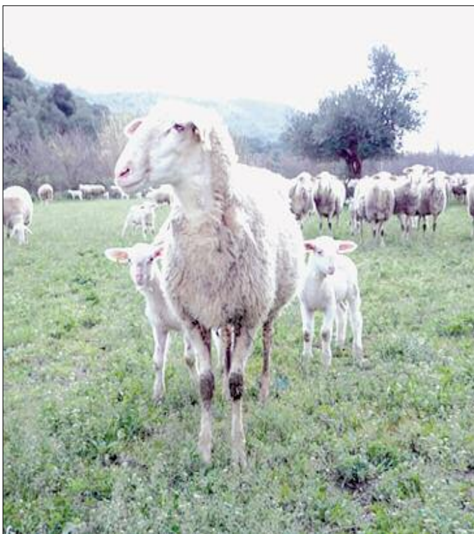
• Περιφράξη και διαμόρφωση αγροτεμαχίων • Αγορά καινούργιου μετσοκομικού και ανθοκομικού αυτοκινήτου • Γενικές Δαπάνες (όπως αμοιβές για τη σύνταξη και υποβολή αίτησης στήριξης και αίτησης πληρωμής, αμοιβές μηχανικών, συμβούλων καθώς και αμοιβές για την έκδοση αναγκαίων αδειοδοτήσεων)

» Προτεραιότητα θα δίνεται στις γεωργικές εκμεταλλεύσεις με τυπική απόδοση μεταξύ 8.000 και 25.000 ευρώ - Ανοιχτή η πρόσκληση για όλη την προγραμματική περίοδο