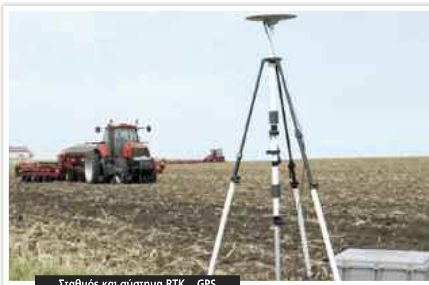
Σταθμός και σύστημα RTK - GPS